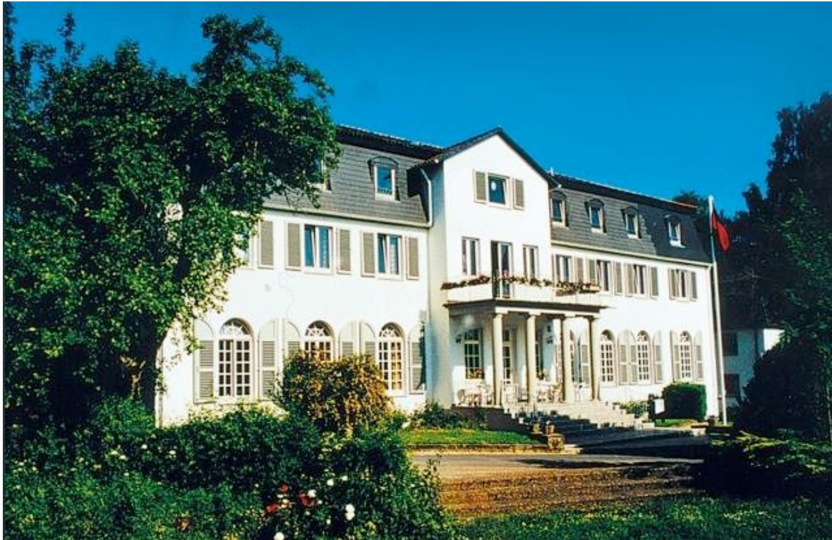
Bildungsstätte und Jugendherberge „Der Heiligenhof“ Alte Euerdorfer Str. 1, 97688 Bad Kissingen